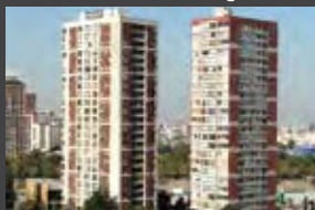
General Prieto 1717, Independencia