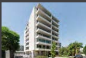
El Vergel 2405, Providencia