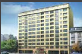
Serrano 62, Santiago Centro