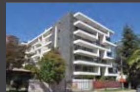
Fernando de Argüello 6955, Vitacura