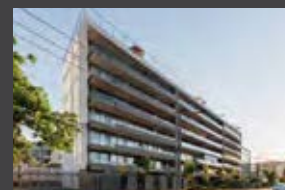
Fernando de Argüello 7755, Vitacura