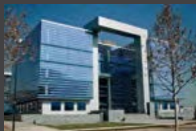
Av. Los Jardines 925, Huechuraba