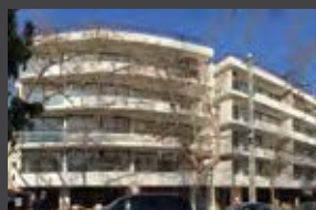
Ricardo Lyon 3200, Ñuñoa