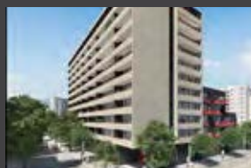
Argomedo 461, Santiago Centro ENTREGA 2021