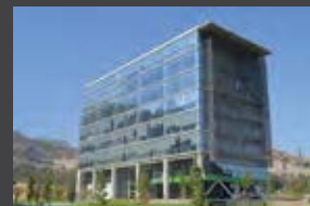
Av del Valle Sur 614, Huechuraba