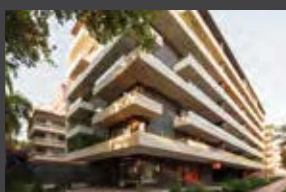
California 2336, Providencia