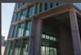
Av Los Jardines 976, Huechuraba ENTREGA 2020