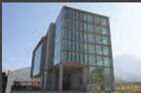
Av. Los Jardines 972, Huechuraba