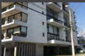
Pedro Lira 1404, Providencia