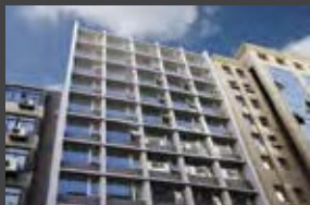
Serrano 73, Santiago