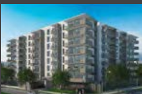
Vicente Valdés 848, La Florida ENTREGA 2021