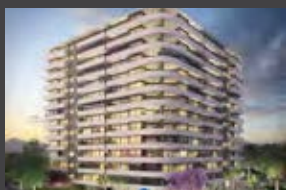
Walker Martínez 1155, La Florida ENTREGA 2021