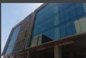
Calle los Jardines 964, Huechuraba ENTREGA 2020