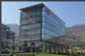
Av del Valle Sur 650, Huechuraba