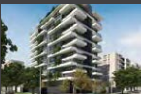
Colón 5739, Las Condes ENTREGA 2022

Av. de Valle Sur 614, Piso 8, Ciudad Empresarial, Huechuraba, Santiago - Chile