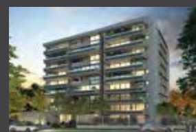
Las Malvas 788, Las Condes ENTREGA 2021